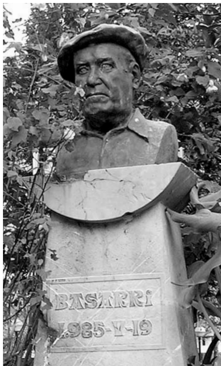
Basarriren Irudia.Zarauz (J.M.I.)

Alde guzietako izparringi ta aldizkingiak goraltzen zaitueten bitartean, aize bultzadan ega bedi Abesbatz zoragarriaren ikurrin itxaropentsua. Aurrera, Euzkadiren aldele zintzoak!