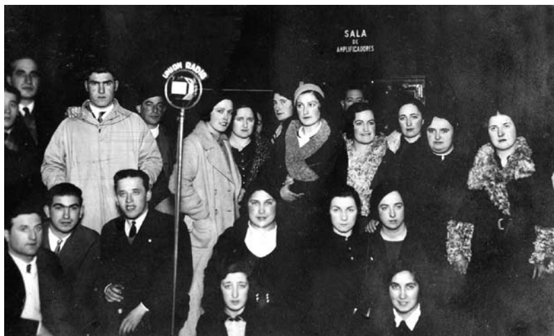
Baserri Zarauzko kantariekin, irratian, 1933.01.25ean.

Igaro dan igandez Azpeitin izan balitz, zer esango ote zuan?