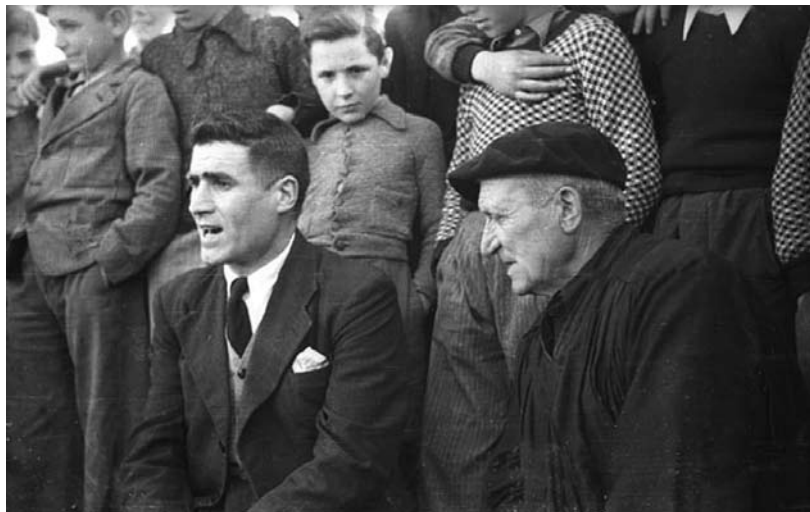
Basarri eta Saiburu (Elosegi)