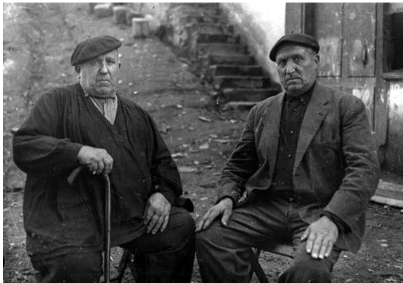
Txirrita eta Saikola lehengusuak (Ind. Ojanguren)

Gora basarritarra! Gora abertzaletasuna!