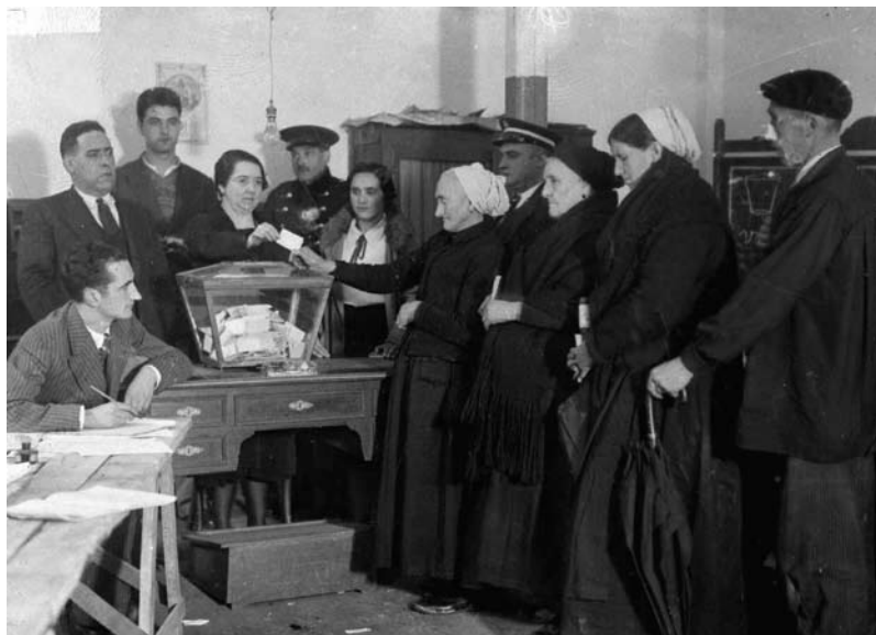
Emakumeak botoa ematen, 1933ko estatuttoa (I. Ojanguren)

Beraz irakurle, badakizu egun orretan nora etorri. Esan zeure lagunai ere, eta etorri aberriaren itza entzutera. Mendigoizale! Etorri, etorri Zarauzko abertzaleak besarkatzera! Etorri itsas-ertzean abertzalez ornituta dagan kabi polit au ikertatzera!