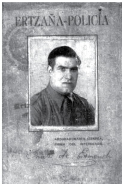
Basarriren ertzain agiria

Goizpai edo Ebanjelio doneak aztertu ditzagun maiz. Premia degula uste dut.