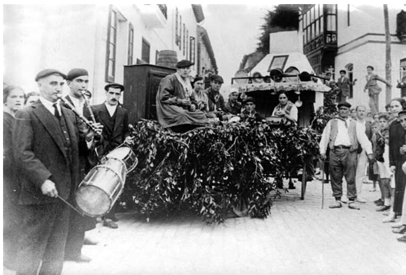
Euskal festa Zarautzen, 1915 (M. Behaeghe)