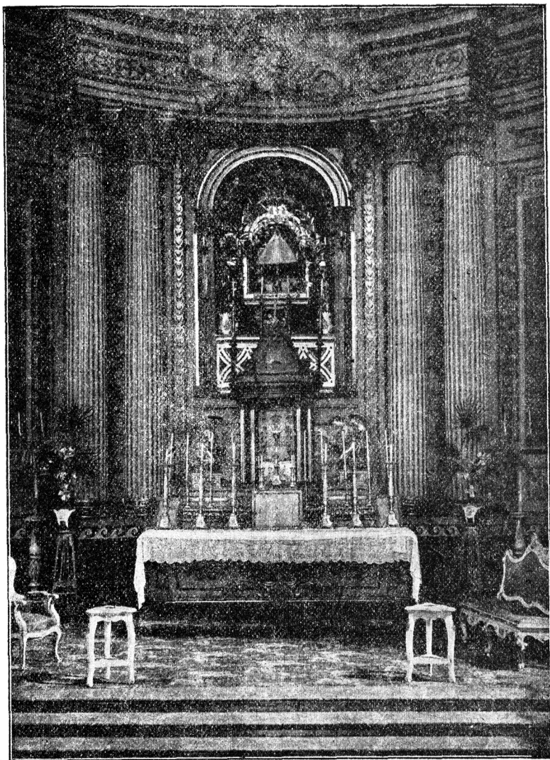
RETABLO Y ALTAR MAYOR EN CUYO CAMARÍN SE VENERA LA IMAGEN DE NUESTRA SEÑORA DEL CORO