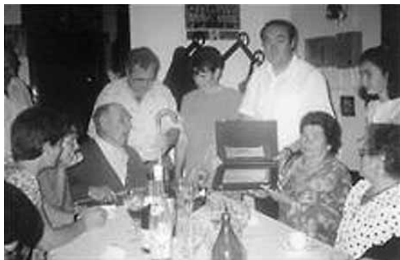
Gurasoei opariak banatzen