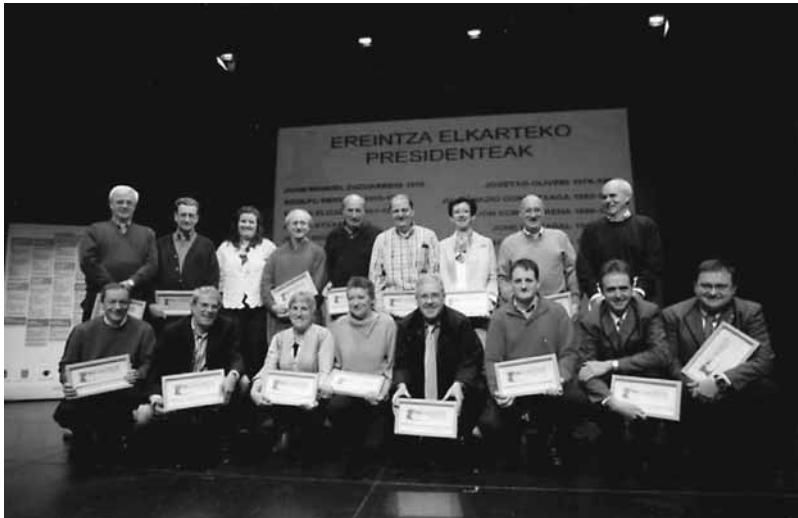
Ereintza Elkarteko lehendakariak (1958-2008)