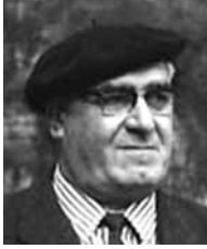
Basarri (1935, 1960)