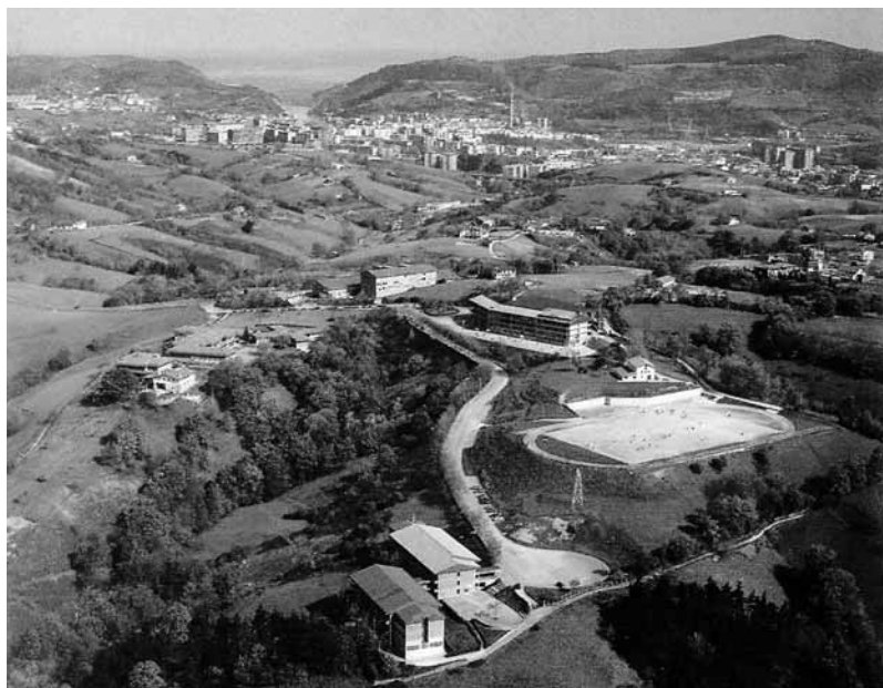
Añabitarteko eremua 2005ean. Geroztik aldatua dago