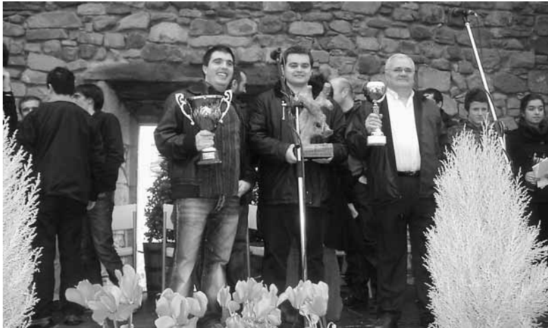
Mungiako "XII. San Antontxu" sariak

2009an jarritako bertso hauek 2010eko "XII. San Antontxu" bertsopaper-lehiaketan (Mungia) 3. saria lortu zuten.