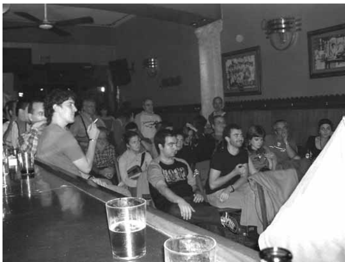
GR-ko bertso-saioak Arkaitza tabernan

Gaur, hogeita bost urte pasata, bistan daukagu emaitza: ongi sendotu dira erroak, egin ondoren lan gaitza; euskal giroko txoko bihurtu, indartuz bertsolaritza. Xenpelar Bertso Eskolak ez du ahaztuko zure eskaintza. Eskerrik asko bihotzez eta mila zorion, Arkaitza!