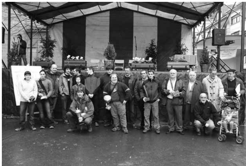
Mungiako "IX. San Antontxu" sariak

2006ko azaroan jarritako bertso hauek 2007ko "IX. San Antontxu" bertso paper-lehiaketan (Mungia) 1. saria lortu zuten.