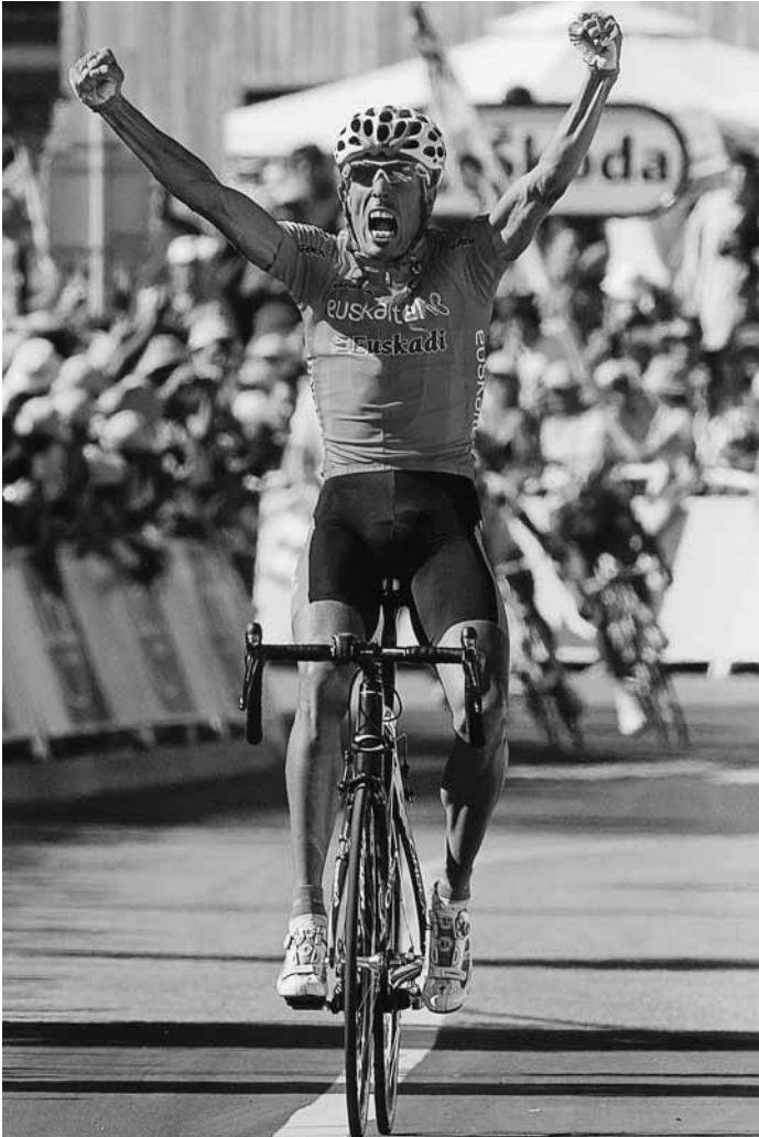
Martigny-Bourg Saint Maurice (2009/07/21)