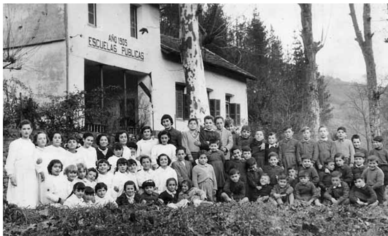
Fagollagako Eskola Publikoa 1956-1957 ikasturtea