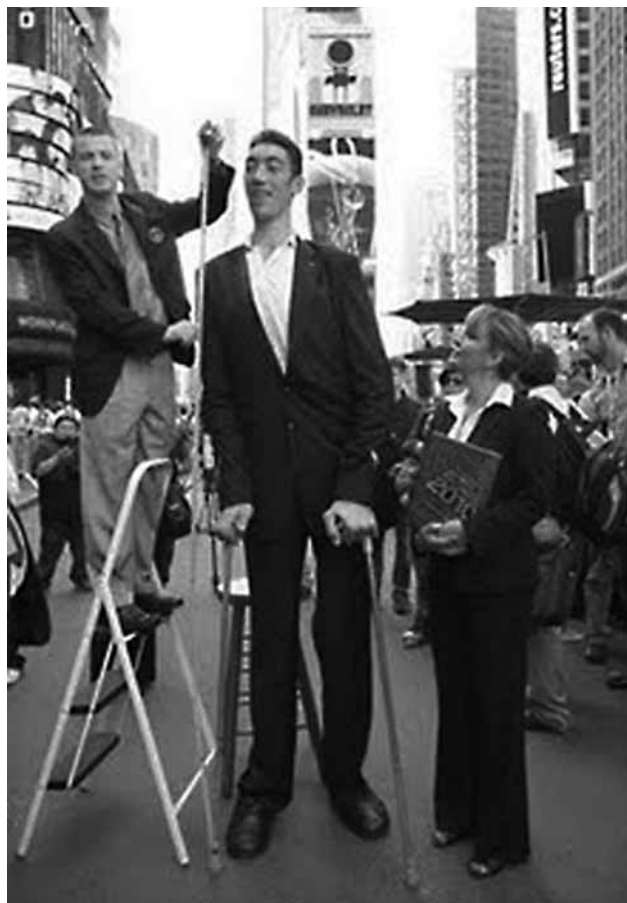
Sultan Kosen erraldoia