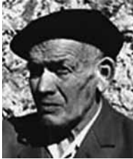
Uztapide (1962, 1965, 1967)