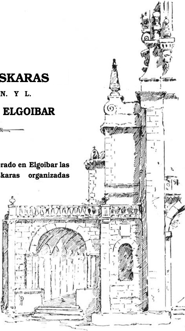
Elgoibar.—Fragmento de la iglesia