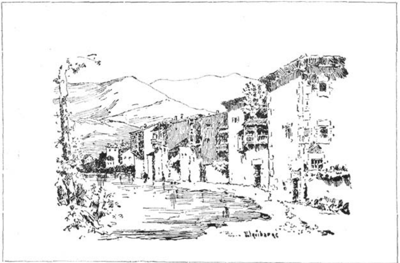
Barrio pintoresco de Elgoibar

los de Mondragón, que es por el que se vino rigiendo esta villa durante muchos años.