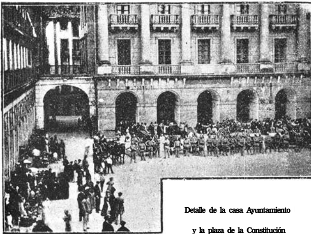
Detalle de la casa Ayuntamiento y la plaza de la Constitución

Monarcas, toreros reputadísimos, moros también muy reputados, personajes conspicuos de uno y otro estado, nacionales y extranjeros,