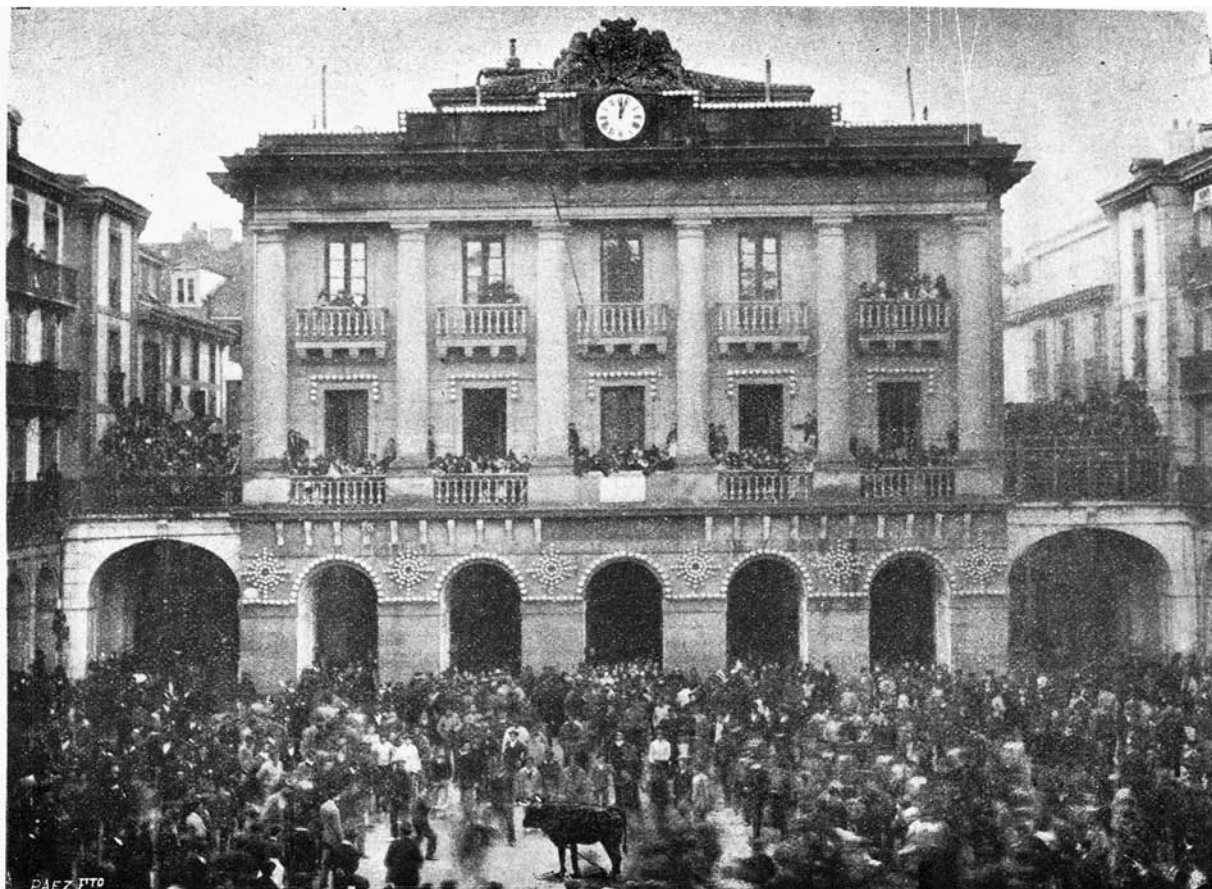
La plaza de la Constitución en tiempos pasados de «soka-muturra» é «iriyarena»