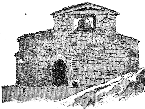
AIZARNA.—Done Engrazia-ren eleizachoa.

Sancti Spiritus izendatzen dan eleizachoa, Done Adrian-go sarreran arkitzen da, ta lengo denboretan Templo-ko zaldunen echea zan. Ez