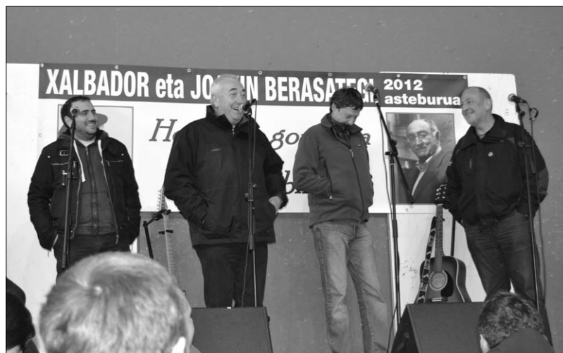
Sarriegi, Gorrotxategi, Loidisaletxe eta Lizaso, Urepele 2012