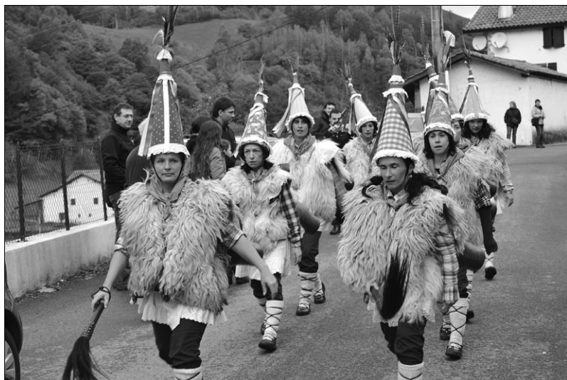
Zanpantzarra, Donapaleuko yoaldunak, Urepele 2012