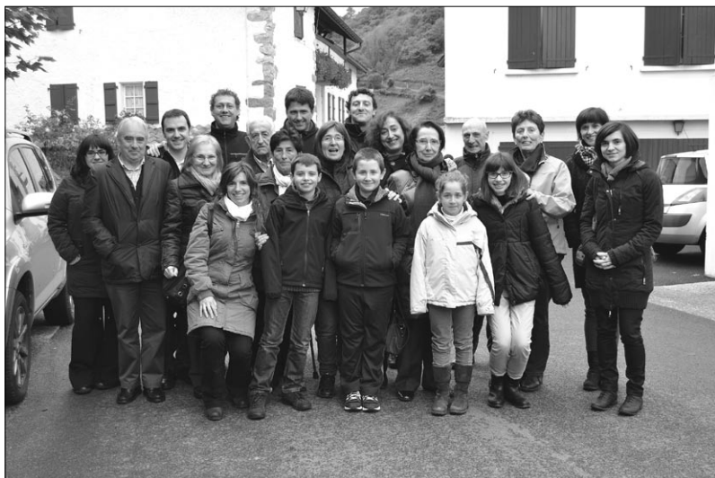
J. Berasategiren alarguna, seme-alabak, errainak, bilobak, anai-arrebak eta ahaideak, Urepele 2012