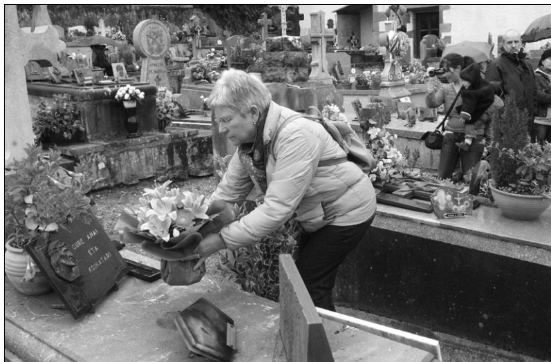
Urteroko lore-eskaintza Xalbadorren hilobian