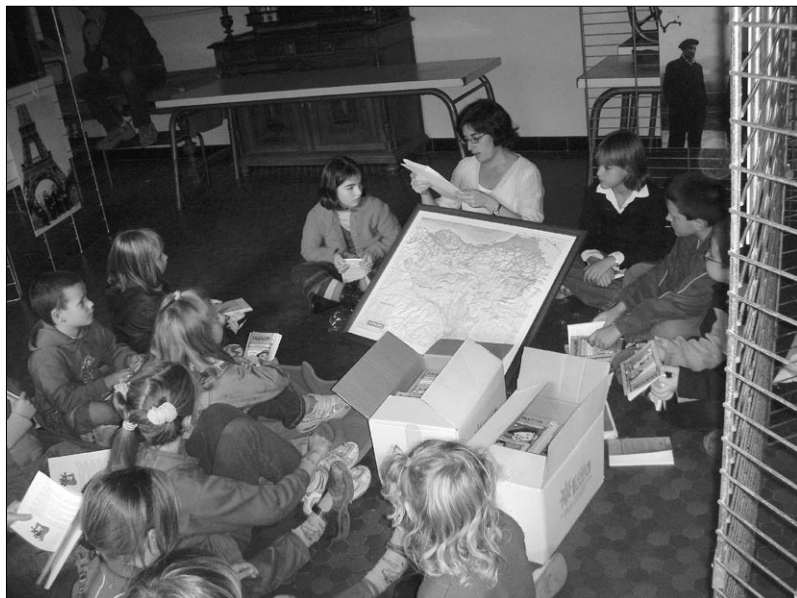
Haurren txokoa, neskato-mutikoentzat