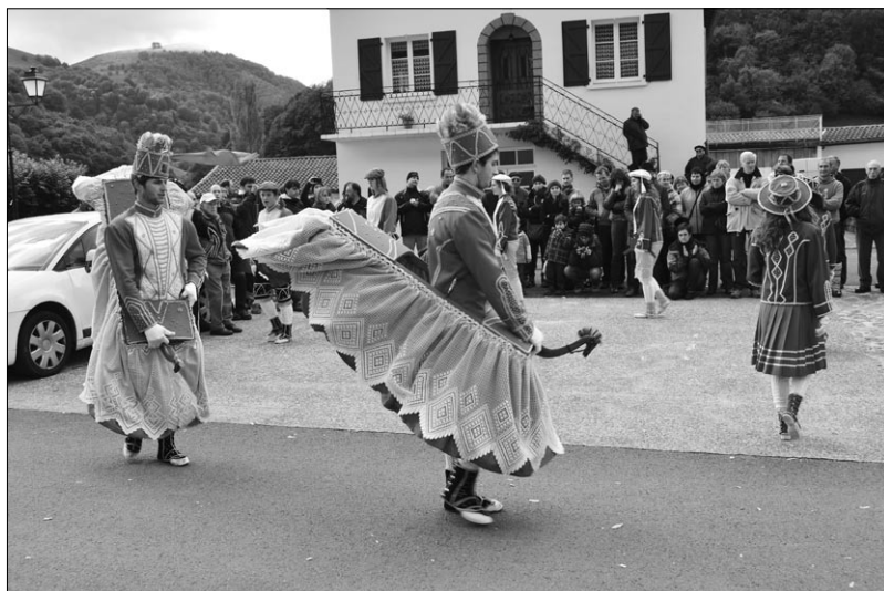
Larraineko (Xiberoa) dantzariak