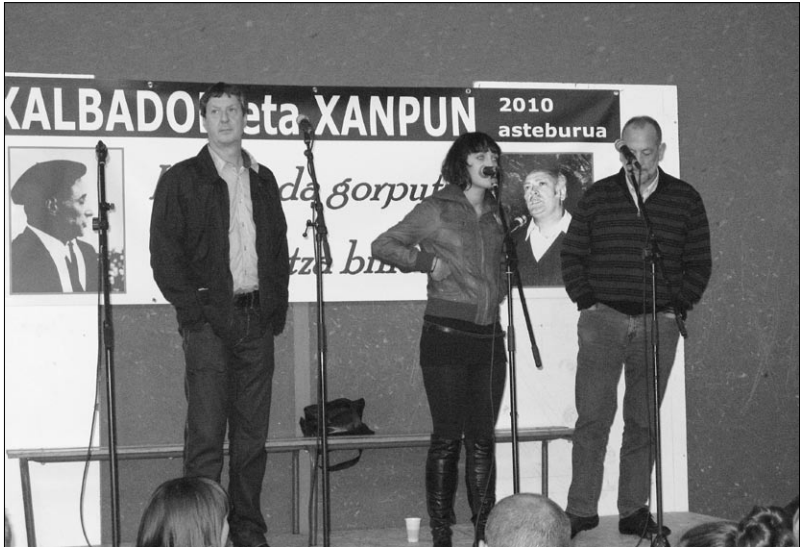
Loidisaletxe II, U. Alberdi eta X Lizaso