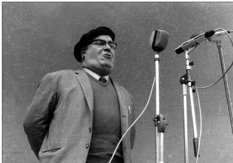
Basarri, Azpeitian 1974