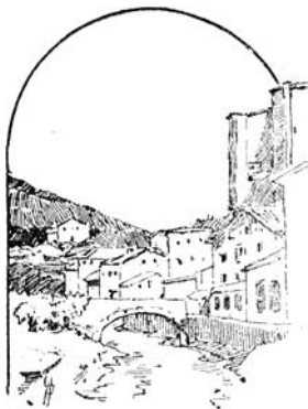
EIBAR. Un detalle

Es una villa de 9.000 habitantes, situada en nuestra provincia, de dimensiones desproporcionadas, porque la longitud es considerablemente mayor que la máxima de las dimensiones transversales.