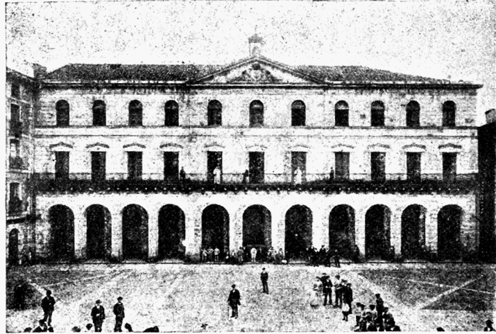
REAL SEMINARIO PATRIÓTICO