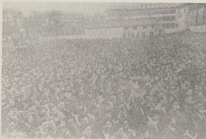
Concentraci3n de patriotas en Donostia antes de 1936.

Con poca diferencia, idénticas previsiones para la Barranka, excepto tal vez para Echarri-Aranaz y Arruazu.