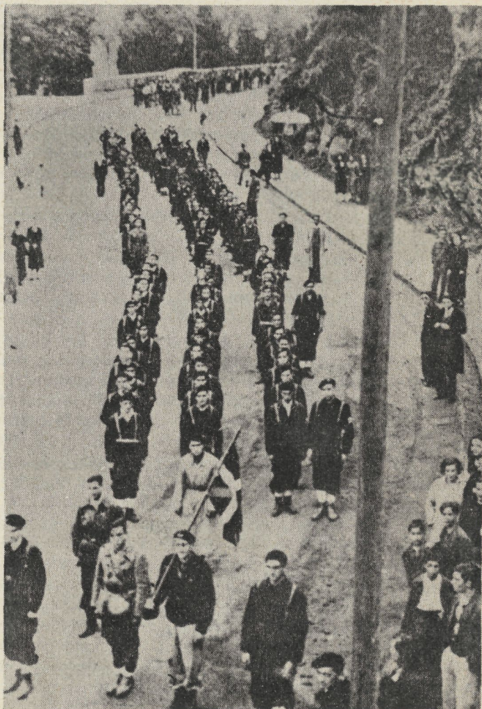
Una compañía de gudararis desfila por Bilbao (1936), antes de dirigirse al frente.

Euskal Herria, reintegrada sobre sus 25.000 km 2 originarios, con una población de 3 millones de habitantes, con una lengua original viva en parte y un apego inconsciente, pero potente, a lo propio (sobre todo en amplias zonas de Euskadi Sur), convertido en polo industrial de primer orden, reúne todas las condiciones para hacer de una Euskadi unificada, socialista y euskaldun, un ideal irresistible.