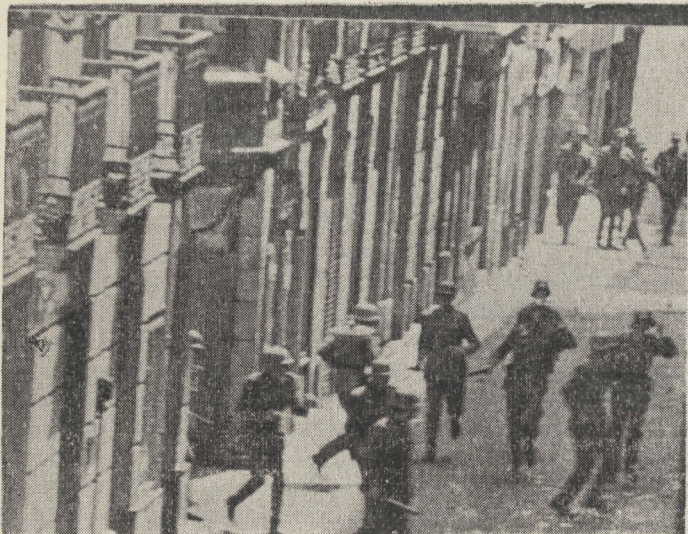
Las escenas de lucha en las calles de Donostia son ya habituales. Estamos en 1968.

He ahí lo que hay que decir claramente. Nosotros no somos « románticos reaccionarios », sino PATRIOTAS PROGRESISTAS. Nosotros no somos solo « demócratas anti-fascistas », sino que somos también REVOLUCIONARIOS ANTI-IMPERIALISTAS. Quien no dice esto, miente ; y prepara un mañana trágico para todos. La forma más sutil de la mentira es la ocultación alevosa de partes esenciales de la verdad.