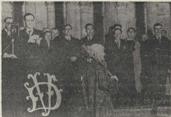
Aguirre, rodeado del Gobierno Vasco, jura su cargo en Gernika. (X-1936)