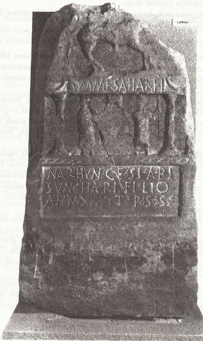
Nafarroako Lergan 1960an aurkitutako hilarri honek argibide hobeak eman ditu euskal penintsulaldearen eta Akitaniaren arteko batasun proto-euskalduna ezagutzeko