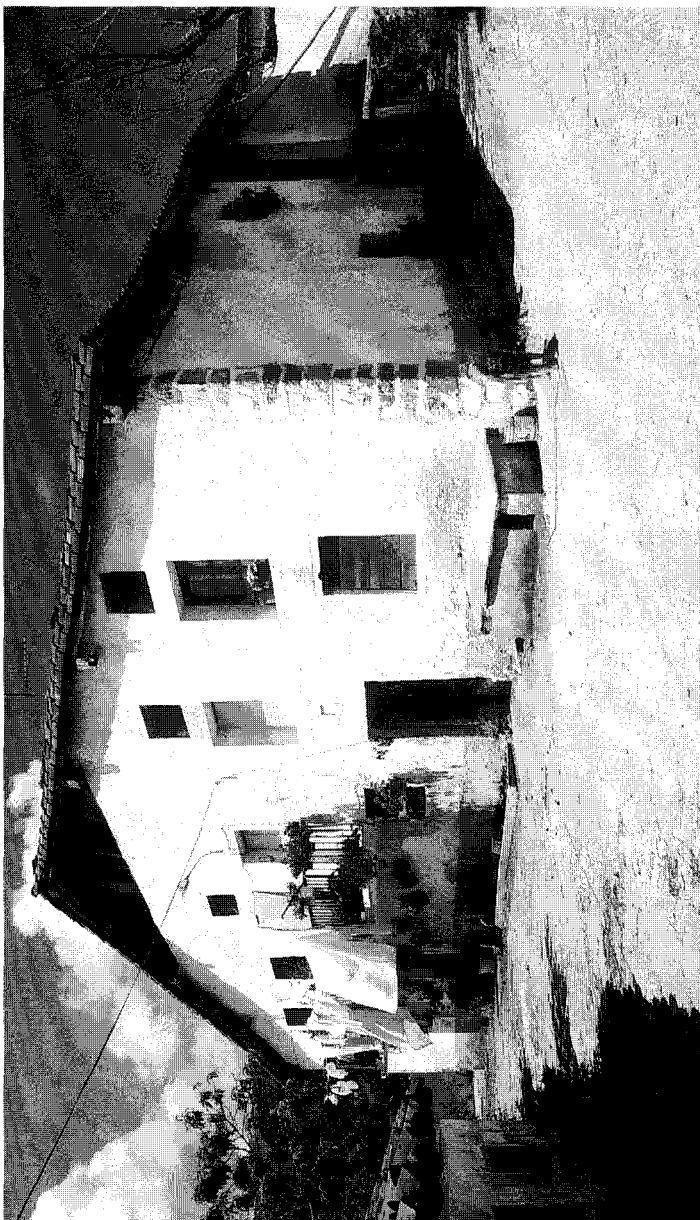
Zialtza baserria, Aia.