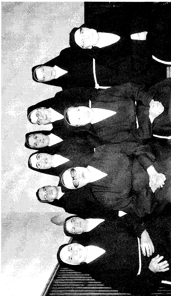
Orduñako Santa Klarako mojak.