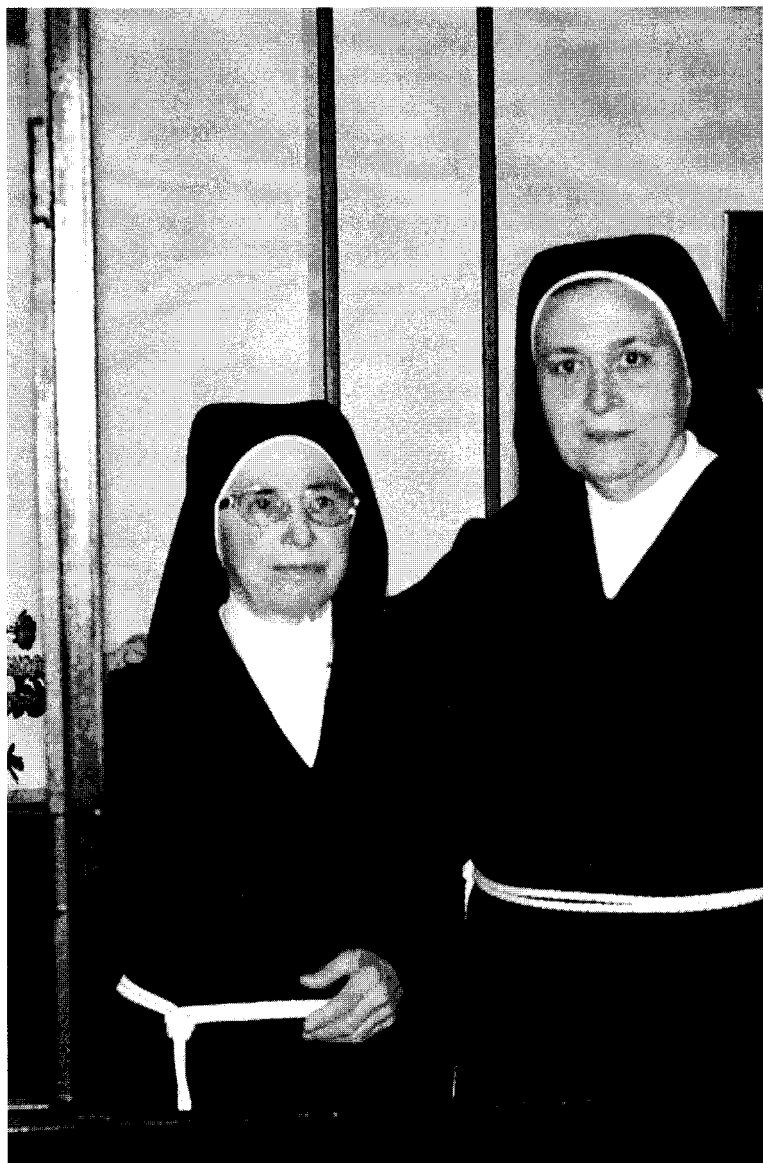
Sor Justina eta Ama Abadesa.