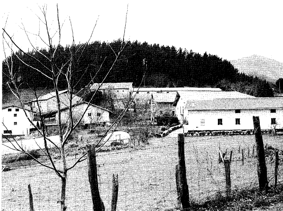
Arta auzunea, Tomas morroi ibili zana.