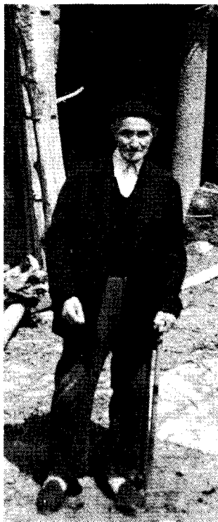
Tomasen aita eta ama