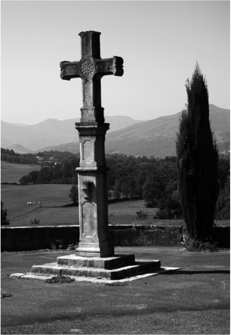
Aintzileko plazako kurutzea.