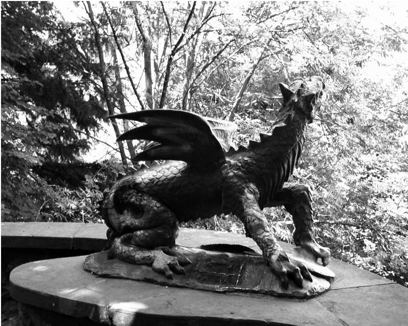
Mondragoiko dragoia, Santa Barbara parkean.

Zeruko Argia, 1970.06.21 Nekez bada ere liburua