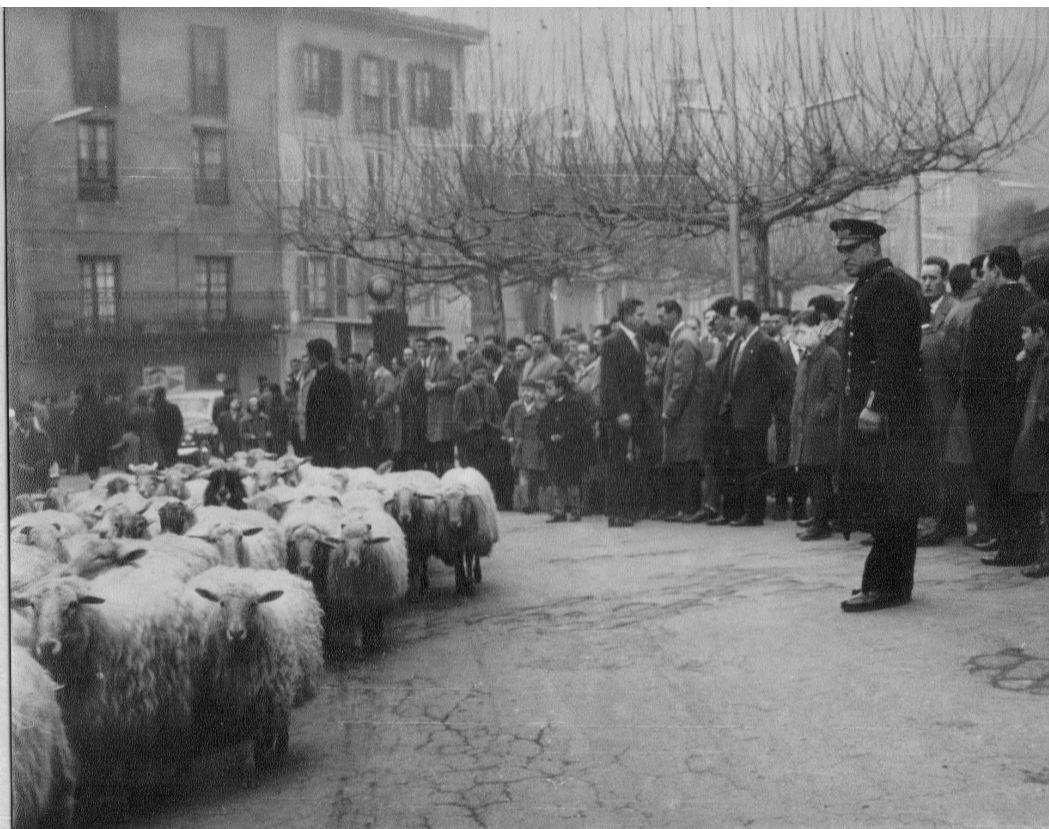
Artaldea Portaloi aurretik.