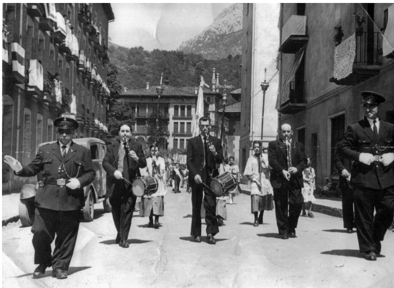
Korpus eguneko prozesioa.

El Diario Vasco, 1980.08.10 Nekez bada ere liburua