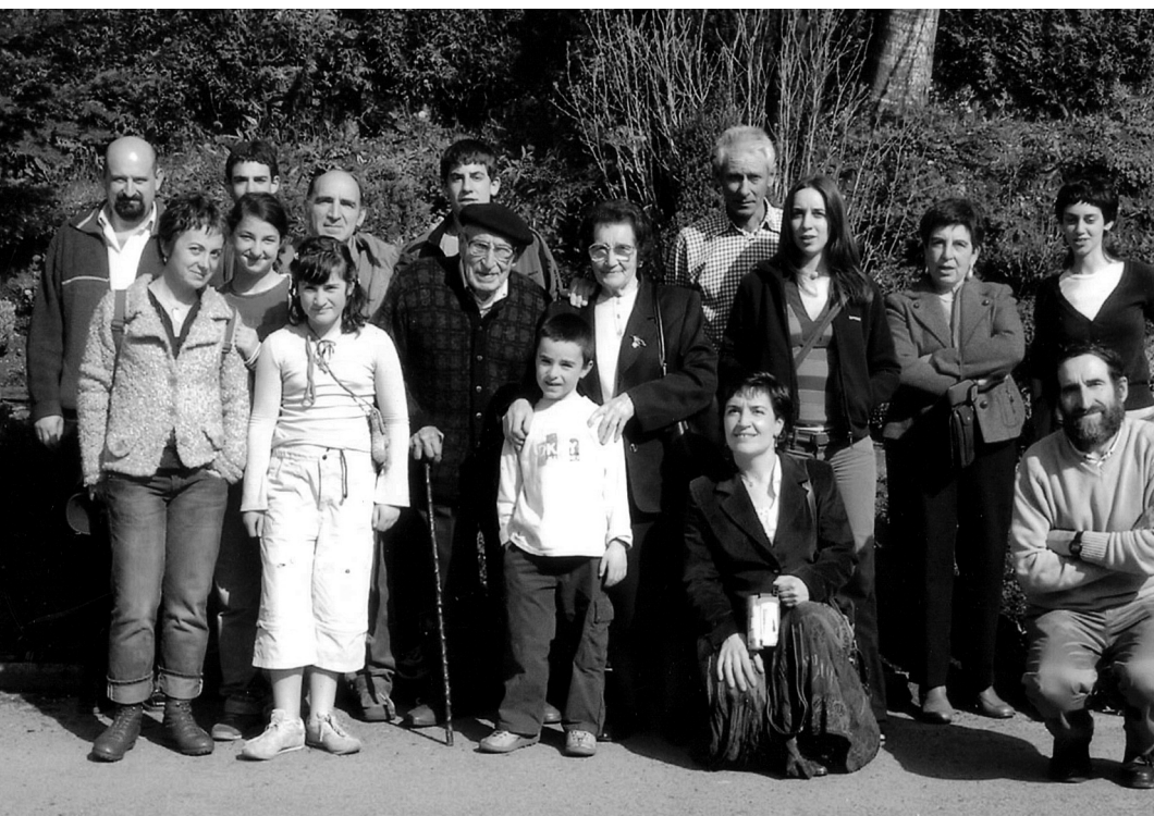
Arriola famili osoa.