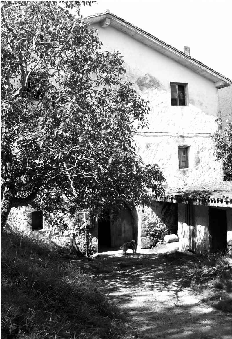
Goikoetxe, Deba, egillaren jaiotetxea.