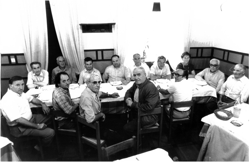
El Diario Vasco-k antolatutako bertsojartzaile billera.