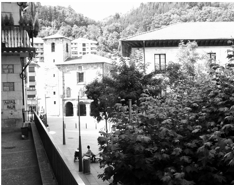
San Frantzisko eliza.

Nekez bada ere liburua El Diario Vasco, 1981.01.04, 7 y 8-gn bertsoak izan ezik