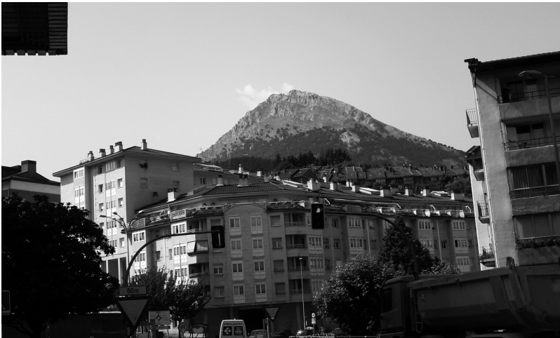
Udalaitz mendia Arrasatetik.

1971-ko azaroak 7 Nekez bada ere liburua