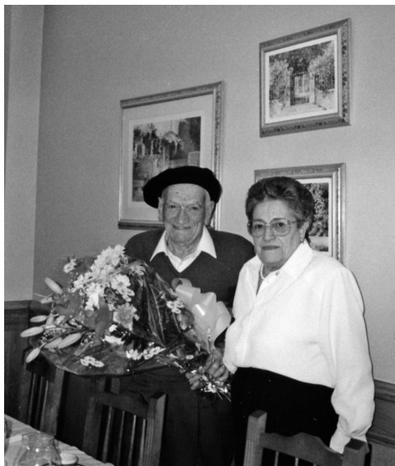
Gurutz eta Mariñe urre-eztaietan.