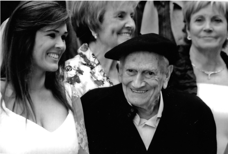
Gurutz, ezkontza batean.

arbol adarrean saltakari beti. Gelditu aurretik gora zagun Txepetxa, ta gora Oñati.