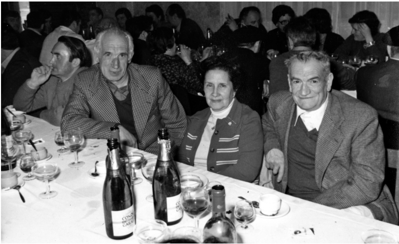
Gipuzkoako okinen festan.