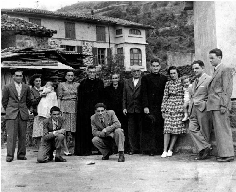
Azkaratetarrak belaunaldiz belaunaldi.