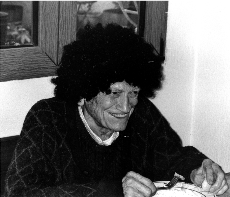
Familiko festa batean peluka jantzita.

ase dezute bere aurrian zendukaten egarria. Beti goguan izan zazute ain egun zoragarria, zeru goitikan onetsi dezan zuen bizitza berria.