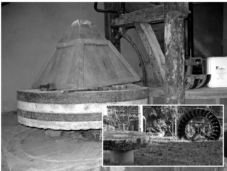
Errota zahar maitea.

Ori izan da motiboa errota guztiak itxita gelditzeko. Bate-ren bat geldituko da museorako, eta leku askotan esango dute: emen errota bat izan zan.