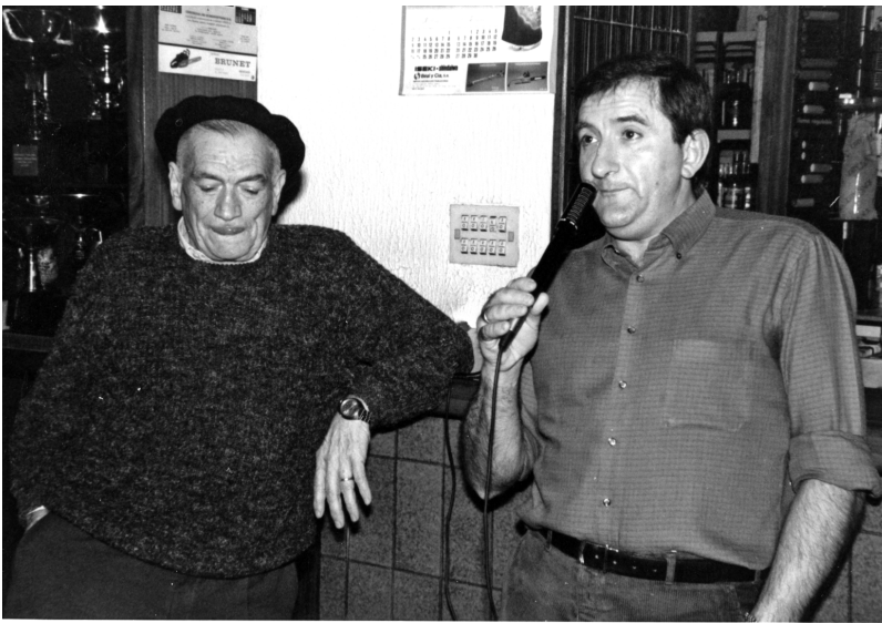
Beti bertsoa buruan.

Baiña oraindik ere bertsotan umorez, naiz itz egiñagatik latz ta itz sakonez. Eta eskatzen dizut gauza bat, faborez: jakin zazu biali bea'uten ala ez.