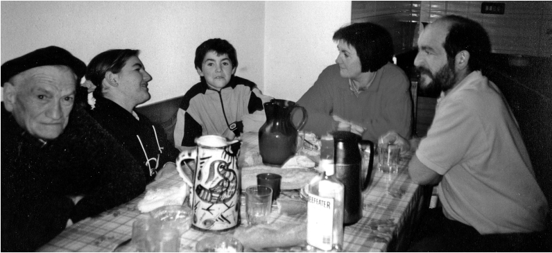
Etxeko giro gozoan.

3 eta 4garren bertsoak ziran izparringian leku faltaz eka- rri ez zituenak. Basarrik bere kontura idatzi zituen nik Arro- lagatik eman nizkion berriak, aipatutako egun orretan.