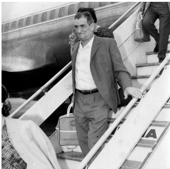
Gurutz hegazkinetik jeisten.