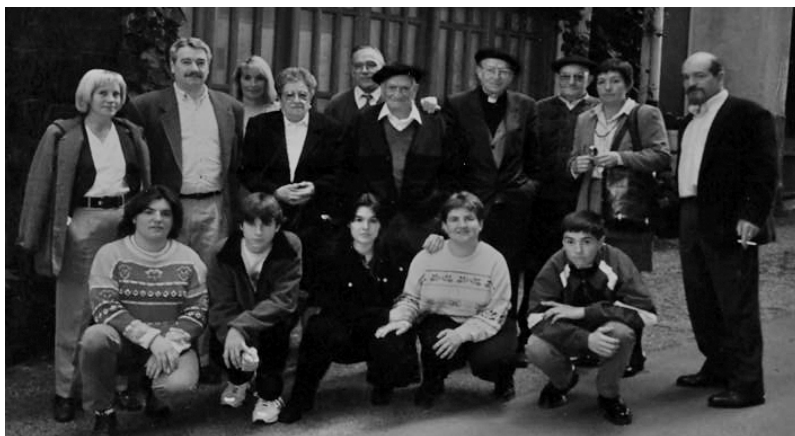
Azkaratetarrak belaunaldiz belaunaldi, 1996-7-7.

Oporrak bukatu dira, bai joan ere laster; ikusiak ditugu makiña bat bazter. Baiña ikasi gabe ez daukagu ezer. Ikasiko al degu ikastolai esker.