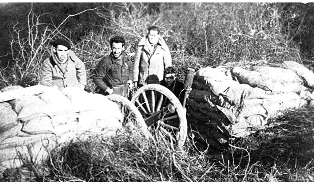
Itxarkundia batalloia.