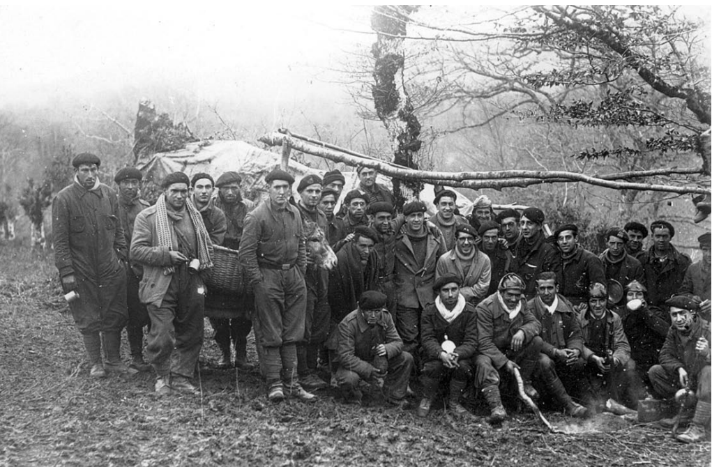
Ixarkundia batailoia.