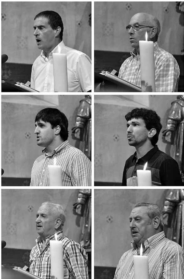
Ferminen ehorzketa, Azkaine, 2013-X-2.