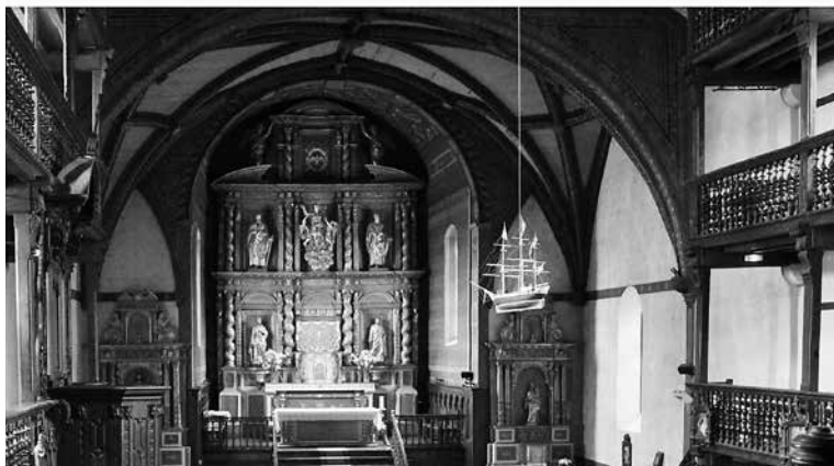
Fermin haureri katixima egiten, 2012. Azkaingo eliza.