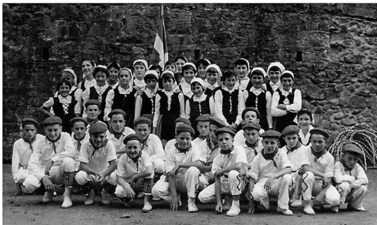
Armadan, 1965; haurra, nerabea eta Azkaingo dantza taldea.