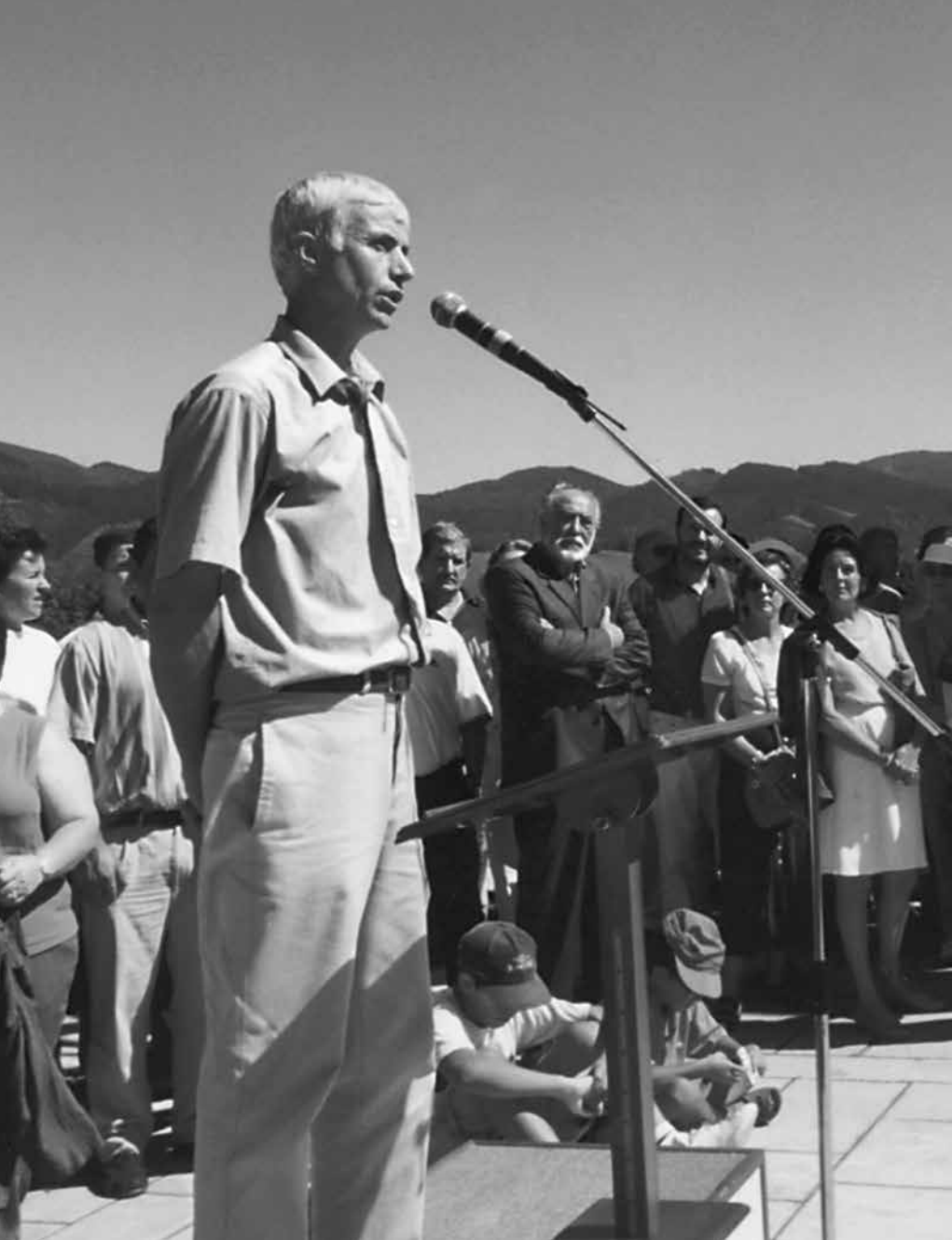
Euskal Herria Euskal Artzainari monumentuaren estreinaldia, Oñati, 1998.