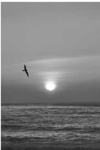
Izadia Euskal Herrian.