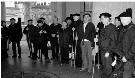
Santa Agedakari etxez etxe Errobi Kanta eta Arroka abesbatzarekin. 1-2: Baiona, 2009. 3: Miarritze, 2004. 4-5: Miarritze, 2010.