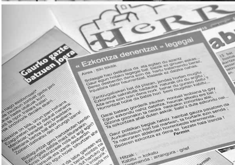
Bertsuak Herria kazetan.