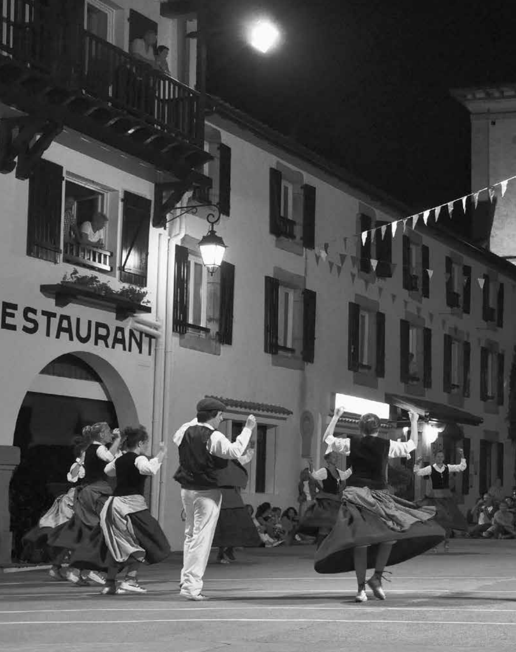
Ikasleak dantza taldea, Azkaine, 2014.