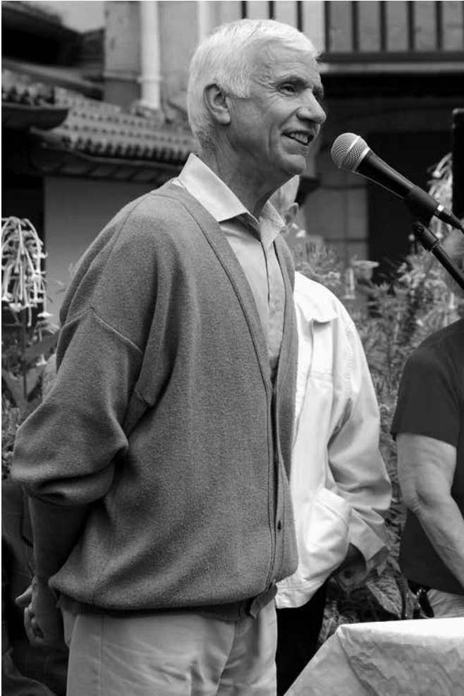
Azkainen, 2009 (arg. Annie Dumay).