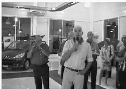
Ferminen lantegian: Gambade garaia berriaren estreinaldia, Basusarri, 2005.