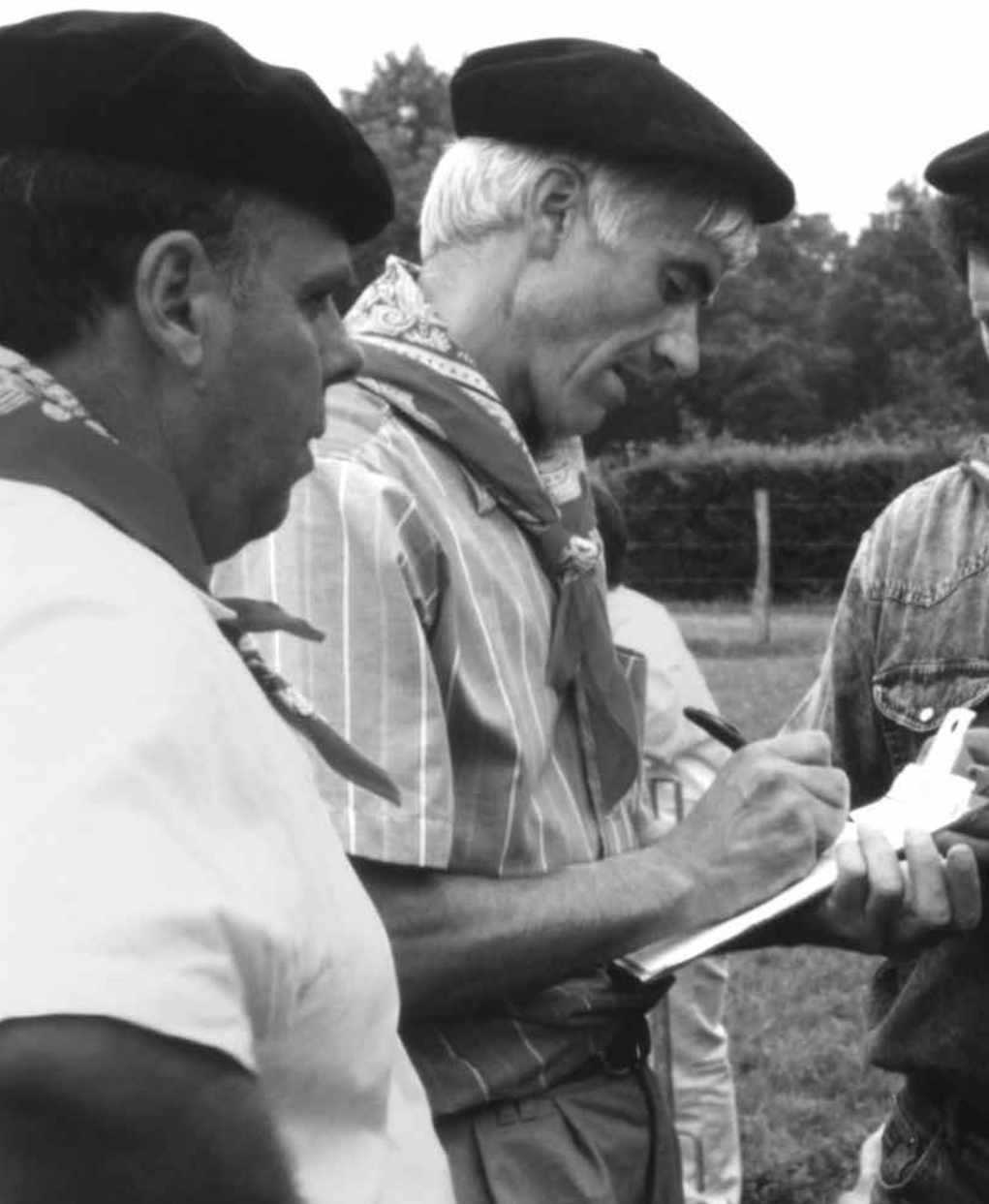
Fermin artzain-xakurren lehiaketa prestatzen artzainekin.