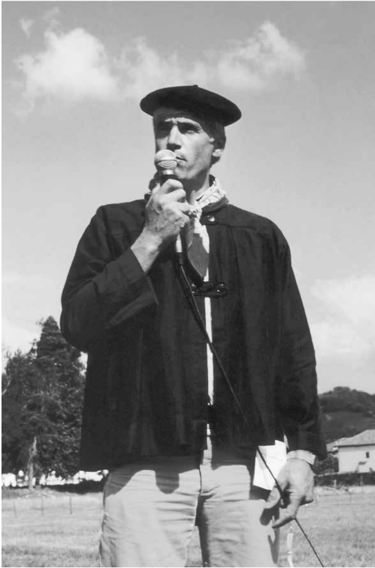
Fermin, artzain-xakurren lehiaketa bat aurkezten.