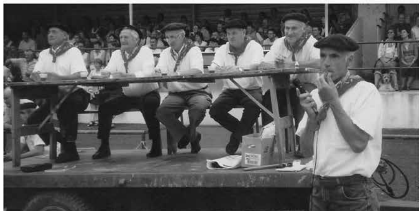
Koxe artzain, semea lehiaketa-aurkezle, 1977. Artzain-xakurren lehiaketak: Azkaine, 2012 eta Baigorri, 2005.