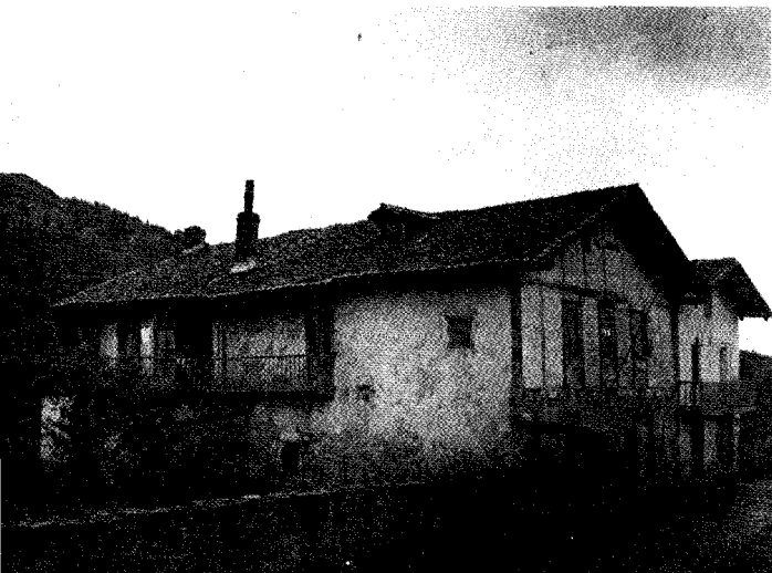
Aierdi baserria, Lexotiren bizi-lekua