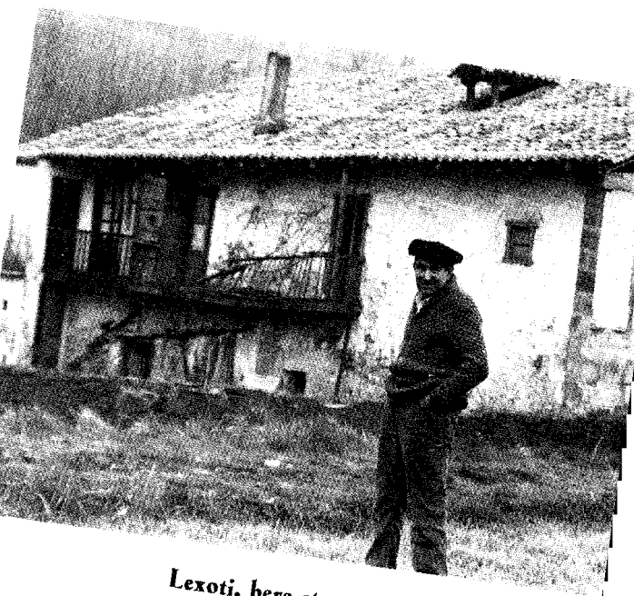
Lexoti, bere etxe ondoan