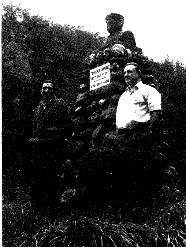
Lexoti ta Mariano Ostolaiz, Ereñozun, Txirritaren oroitarrian.