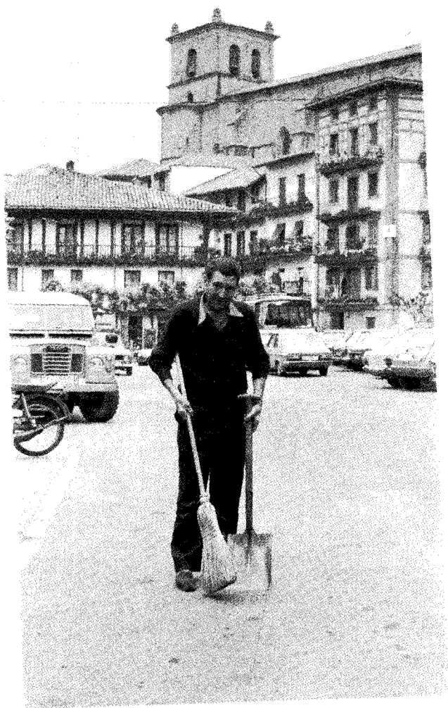
Lexoti, bere gaurko langintzan