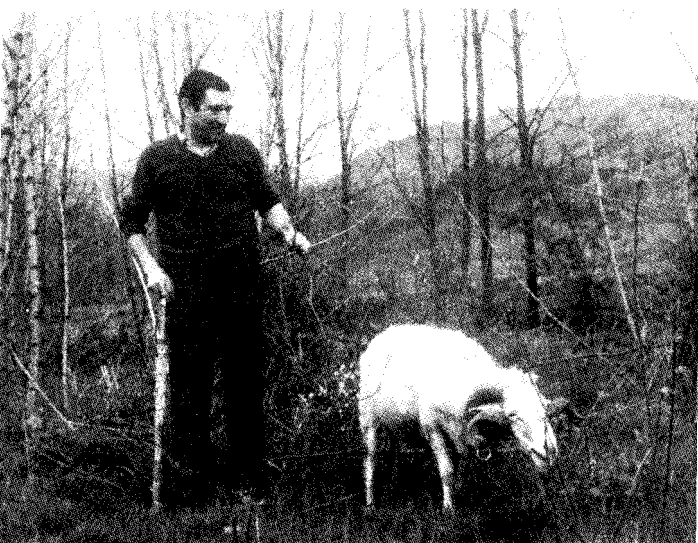
Lexoti, bere aariarekin