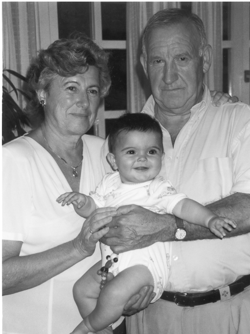
Maddi, gure zoramena.