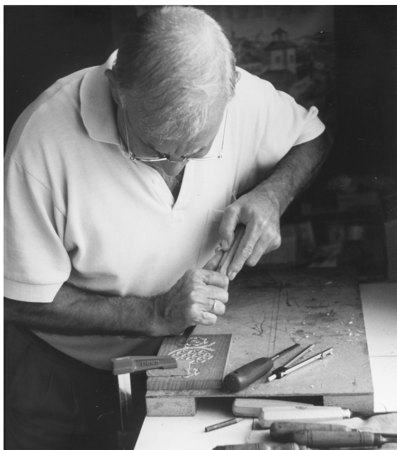
Maite dut zura lantzea.