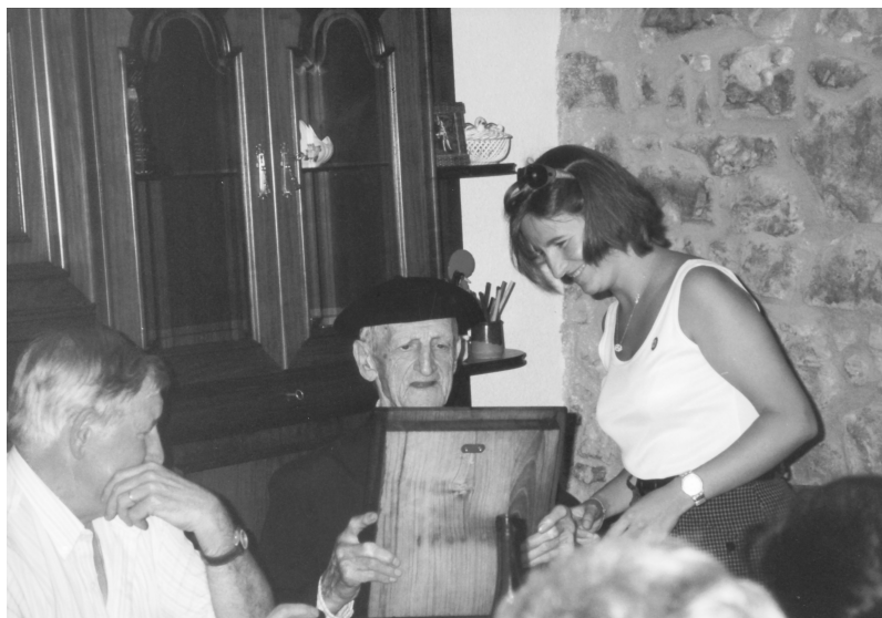
Biloba, aitona zenari oroigarria ematen.