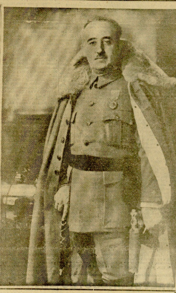
EL GENERAL BAYLA