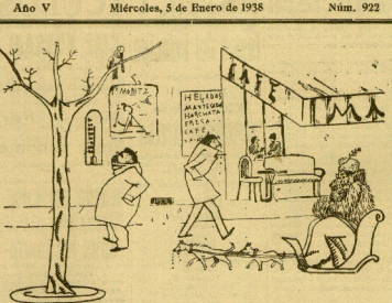
CONTINUA EL VERANO EN SAN SEBASTIÁN (Por Cudroño)