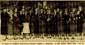
Un grupo de modistas elaborando sombreros y tocados... en el taller...