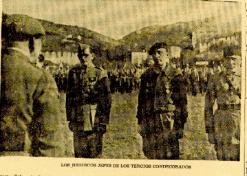
Los heróicos jefes de los tercios condecorados