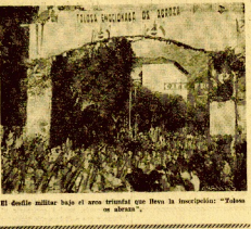
El desfile militar bajo el arco triunfal que lleva la inscripción: "¡Bajo un arco!"