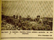
Los frentes de Asturias. Nuestros bravos soldados apostados en un sector del frente.

Boletín de información del Cuartel General del Generalísimo