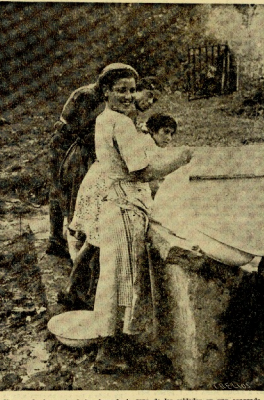
Una mancha santandereana haciendo la sopa de las alubias en una casa...