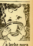
La leche pura no le gusta pero...

La intencionada fracasa de la aviación marxista para bombardear Zaragoza. Otra intencionada fracasada de la aviación marxista para bombardear Zaragoza.