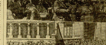
Mios ingenieros militares por San Fernando.

Mios ingenieros militares por San Fernando. Mios ingenieros militares por San Fernando. Mios ingenieros militares por San Fernando.