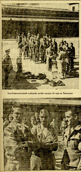
Grupo de prisioneros internacionales, en Sézanne después de enterarse de la orden del Generalísimo de ponerlos en libertad