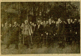
Las autoridades pronunciando la magna procesion del jueves