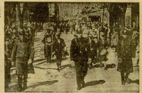
El Ayuntamiento en corporación recordando las Emociones