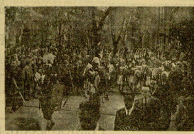
Los soldados vascos