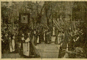
La Cofradía de Nuestro Padre Jesús Nazareno