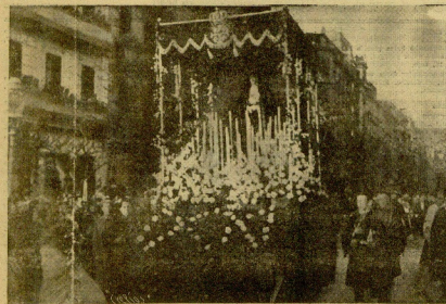
"Mater Dolorosa" paso de la procesion del Buen Pastor