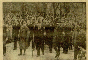
El grupo de honor de los que recibieron peticiones y pasiones de...