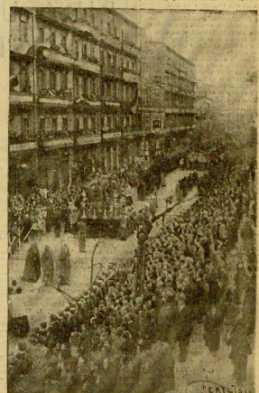
La procesion al pasar por la calle de Urbión