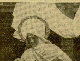
El Decretum, babilonio para que figuré en la proclama del Santo Emperador, que salió ayer de San Vitorio.

El punto de partida es el siguiente: que los señores de la prensa, de Brno, Francia, se reúnan en la casa de la calle de Brno, Francia, para discutir sobre la situación de la prensa.