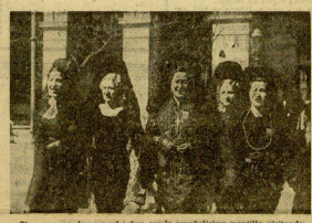
Cinco muchachas vascas, con la española en mantilla, visitando los lugares