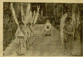
La Verónica precedida del Coro de Angels