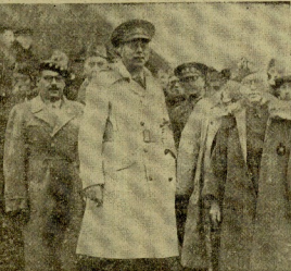
El General Mañé y demás autoridades en la ceremonia

Ayer, a las 6 y media de la tarde, fué inaugurado, la apertura del tráfico del viaducto de Ormaiztegui. Como muestra de la obra, se celebró un momento de silencio, en el que se leyó un discurso. El General Mañé, Jefe de la División de Obras Públicas, presidió la inauguración. En el acto, se leyó un discurso de bienvenida, en el que se elogió la obra y se deseó que sirviera para el progreso de la zona. El General Mañé, Jefe de la División de Obras Públicas, presidió la inauguración. En el acto, se leyó un discurso de bienvenida, en el que se elogió la obra y se deseó que sirviera para el progreso de la zona.