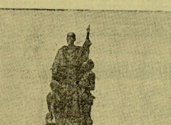
Ilustración de un hombre que aparece en el texto, posiblemente un explorador o navegante.

Un relato del viaje de regreso de Francisco de Ulloa. Él describió sus experiencias en América y cómo regresó a Europa.