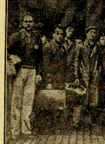
Los marinos guipuzcoanos dispuestos a marchar para incorporarse a su destino