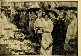
El Alkalde y compañía ante los túmulos de varias víctimas del Frente Popular...