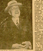
JOHN ROCKEFELLER Y SU ESPOSA HANNAH ALLEN

En los últimos días, se ha publicado un libro titulado: «Cómo hacerse rico en Washington». Este libro, que ha sido escrito por un autor anónimo, describe cómo se hicieron ricos algunos de los multimillonarios más famosos de los Estados Unidos. El libro es un manual de instrucciones que describe cómo se hicieron ricos algunos de los multimillonarios más famosos de los Estados Unidos. El libro es un manual de instrucciones que describe cómo se hicieron ricos algunos de los multimillonarios más famosos de los Estados Unidos.