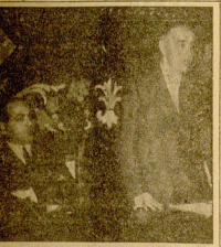
EL MINISTRO DE AGRICULTURA EN SEVILLA El señor Cuesta durante la charla en el día de apertura del curso de la Escuela Agrícola de Sevilla.