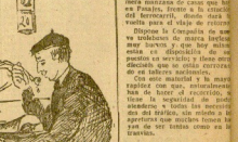
LA TRAVIA DEL TONEL

Algunos que viven en la Caserío de Pasajes, en el barrio de San Sebastián, y que se dedican a la venta de papeletas de archivos donostiarros, han sido denunciados por el Ayuntamiento de Pasajes.