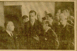
Nuevo edificio de la Sociedad de Naciones. El ministro de Exteriores alemán, Adenauer, el británico, Eden, el belga, Schuman y el norteamericano, Acheson, reunidos en la sesión formal de la Sociedad General de Naciones.

Ingreso en la N. A. T. O. y trato de igualdad, pide el primero Acuerdos previos sobre os "criminales de guerra"