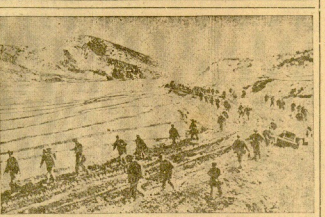
GUERRA SOBRE LA NIEVE. Soldados de la Armada de los Estados Unidos patrullando en las montañas nevadas de Corea.

WASHINGTON.—El presidente de Estados Unidos, Truman, ha anunciado que si el gobierno soviético no acepta las condiciones de un armisticio en Corea, el ejército de los Estados Unidos responderá de idéntica forma que en Corea.