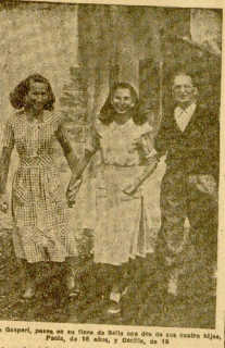
De Gasperi, jefe del Gobierno italiano, se enfrenta a una tarea doble: luchar contra el comunismo y preparar el terreno para el ahorro y el espíritu de empresa.

La industria de Gasperi, jefe del Gobierno italiano, se enfrenta a una tarea doble: luchar contra el comunismo y preparar el terreno para el ahorro y el espíritu de empresa. Gasperi, jefe del Gobierno italiano, se enfrenta a una tarea doble: luchar contra el comunismo y preparar el terreno para el ahorro y el espíritu de empresa.