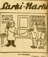
SIN PALABRAS (Continuado)