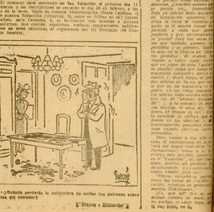
¿Boda por amor o por conveniencia política?

El concurso se celebrará en Bilbao y tendrá como objetivo promover el arte de la canción popular. Se recibirán inscripciones hasta el día 31 de agosto. Los ganadores recibirán un premio en metálico y un diploma.