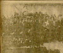
Las víctimas de las avalanchas de nieve en Suiza. En primer plano, una mujer con un niño en brazos. A la izquierda, un hombre con un niño en brazos. A la derecha, un hombre con un niño en brazos.