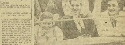
Una de las bailarinas que se levanta de los brazos del mar. El mar Negro y el mar de Mármara.

Los señores Astor, Lady y Lord Astor, han asistido a nuestro festival folklórico. Los señores Astor, Lady y Lord Astor, han asistido a nuestro festival folklórico.