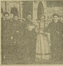
Abajo: Una península que se levanta de los brazos del mar. El mar Negro y el mar de Mármara.

Después de diez días de fiesta, en esta feria de una gran belleza, se ha cerrado por un momento el ciclo de un festival que se ha celebrado en el gran salón de baile de este hotel. En la noche del día 20, se celebró el último día de fiesta, en el que se dio un gran espectáculo de baile y canto. El festival folklórico organizado por el Diario Vasco, ha sido un éxito rotundo. Los bailarines y cantantes han sido muy aplaudidos por el público. El festival folklórico organizado por el Diario Vasco, ha sido un éxito rotundo. Los bailarines y cantantes han sido muy aplaudidos por el público.