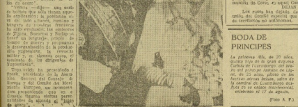
El jefe de la Gendarmería de Taegu, en la zona de Taegu, se plantearon el día 19 de Pyongyang, 15 kilómetros al sur de Taegu, y al día siguiente, el día 20, se plantearon en Taegu.

Los rusos han dejado de asistir por segunda vez a la reunión de un comité de la O. N. U.