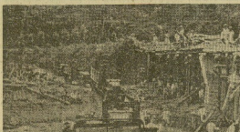
Winston Churchill, primer ministro británico, se pronunció hoy en la Asamblea General de las Naciones Unidas en Ginebra, Suiza, al declarar que el origen de la guerra en Corea se encuentra en la política de agresión de la Unión Soviética.

El primer ministro británico, Winston Churchill, se pronunció hoy en la Asamblea General de las Naciones Unidas en Ginebra, Suiza, al declarar que el origen de la guerra en Corea se encuentra en la política de agresión de la Unión Soviética. Churchill afirmó que el origen de la guerra en Corea se encuentra en la política de agresión de la Unión Soviética. Dijo que el primer ministro británico, Winston Churchill, se pronunció hoy en la Asamblea General de las Naciones Unidas en Ginebra, Suiza, al declarar que el origen de la guerra en Corea se encuentra en la política de agresión de la Unión Soviética.