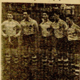
El equipo de la Selección Guipuzcoana en acción durante el partido jugado en el campo de la Vizcaya.

El partido se jugó en el campo de la Vizcaya, y el resultado fue de 5-0 a favor de la Selección Guipuzcoana. El partido se jugó en el campo de la Vizcaya, y el resultado fue de 5-0 a favor de la Selección Guipuzcoana.