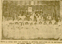
Niños y niñas que han tomado la primera comunión en el parroquial de Santa María.