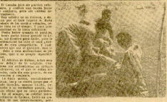
Caritas. Uno de los juegos del Asilón. Asaje. En un exhibición a continuación de una leona