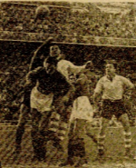
Se aferra sobre la puerta del Plus Ultra el jugador de su club...