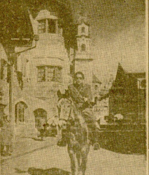
A caballo, a ganar el Jubileo