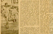
El encuentro que sin dificultades la...