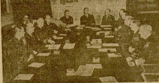
Los jefes del E.M. yanqui, con el jefe del E.M. español en el centro, se reúnen en Fontainebleau en el Ministerio de Defensa de Londres.