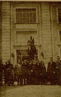
Los alumnos argentinos regalan un banderín a los chicos de San Sebastián. En primer plano, el niño argentino que ha regalado el banderín.