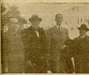
El representante de la República Dominicana en Madrid...